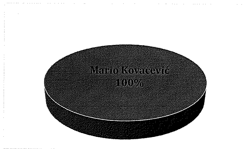
Vlasnička struktura prije i nakon mjera restrukturiranja